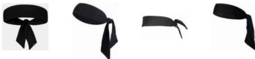
Figure 1 : Bandeau de tête de type bandana

Le port de bandeau de tête de type bandana (bandeau noué) n'est pas autorisé