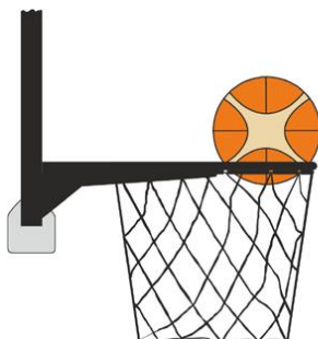
Figure 4 : Ballon à l'intérieur du panier

Il y a violation pour intervention illégale si un joueur défenseur touche le ballon quand il est à l'intérieur du panier.